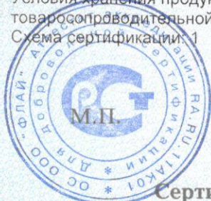
Схема сертификации: 1

Условия хранения продукции, срок хранения (службы, годности) указан в прилагаемой к продукции товаросопроводительной и/или эксплуатационной документации.